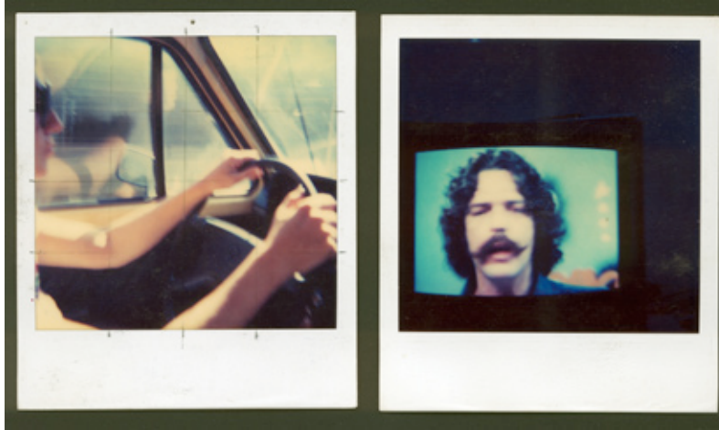
Polaroids para la suite El Son-UR-Gente 1986, y Sin título (entrevista de TV) 1977.

“Es reconocido como uno de los artistas más provocadores e importantes de este país. Participante activo en el movimiento FLUXUS cuando residió en Europa en los 70s y luego, a su vuelta a México, protagonista del Fenómeno Grupal. Ehrenberg ha escrito capítulos en la historia nacional del cine experimental, del arte sonoro, la performance, el videoarte y hasta en cuestiones digitales. Ha sido cómplice, maestro, tutor, mentor, avatar y padrino de un sinnúmero de artistas de varias generaciones, en diferentes latitudes y longitudes. Muchas de sus propuestas fueron tan polémicas que cambiaron el rumbo del arte en México.