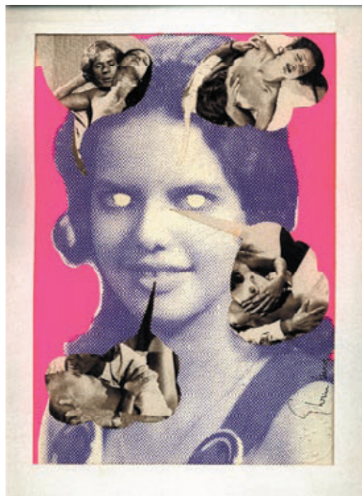
Sin título # 2 y Sin título # 3 (de la serie "obras irreproducibles") 1974