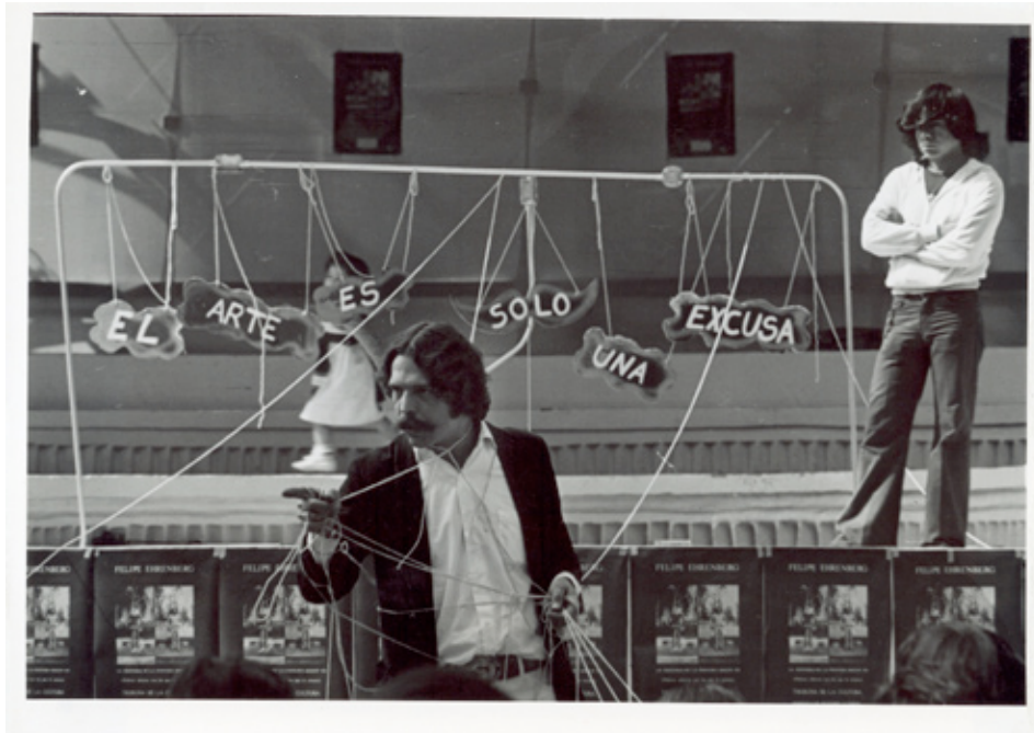
El arte es sólo una excusa, registro de acción, 1979

El Museo de Arte Moderno de la Ciudad de México expuso Manchuria Visión Periférica , retrospectiva de Felipe Ehrenberg, abierta al público del 21 de febrero al 22 de junio de 2008. Este proyecto se articula dentro de la vocación del Museo de Arte Moderno dentro de la recuperación de las expresiones artísticas excluidas del lenguaje actual, así como parte de su vocación por difundir a artistas mexicanos de media y larga carrera de las últimas décadas.