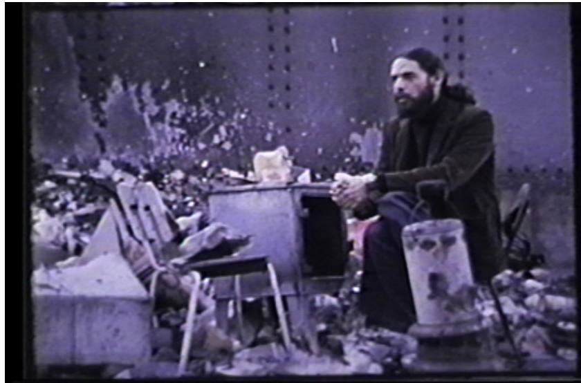
La Poubelle , video, 1970