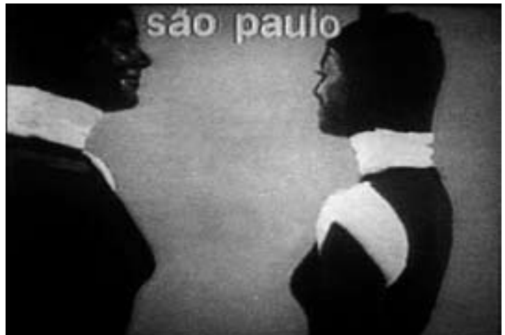
“M 3x3”, Analivia Cordeiro, 1973